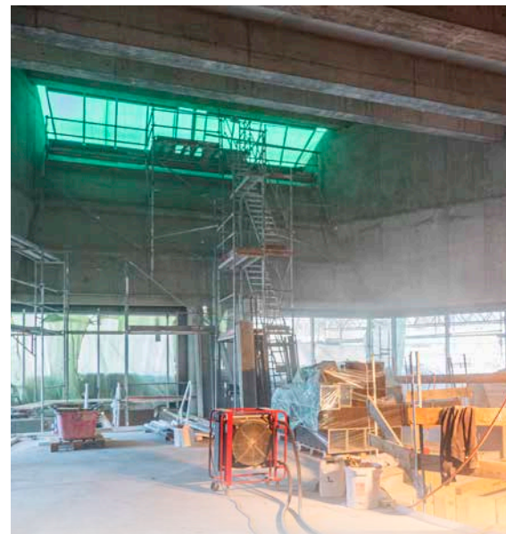
Foto links: Die Schoggi-Häsli sind ab 10. März in der Confiserie Himmel in Baden und in der Bäckerei Frei im Markthof Nussbaumen erhältlich.