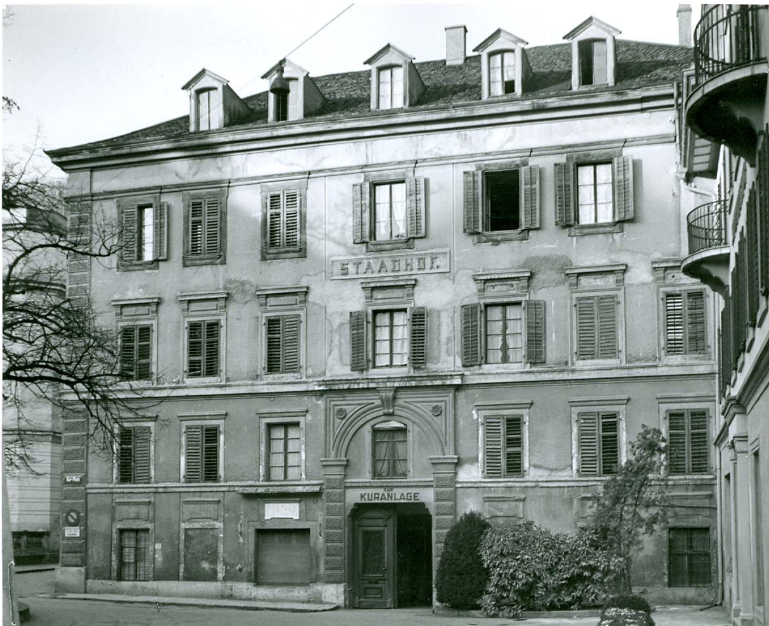
Der Hauptbau des alten „Staadhofs“ von 1815 in den 1940er-Jahren.

Hof am Rey von altersher Den Nam ich getragen hab'. Conrad am Staad besitzt mich viel Jahr, Darum ich Staadhof betittelt war. „Staadhof“, nicht Stadthof heiss ich weil Konrad am Staad hat besessen mich; Conrad Am Staad und Salome Schwendin. 1470.