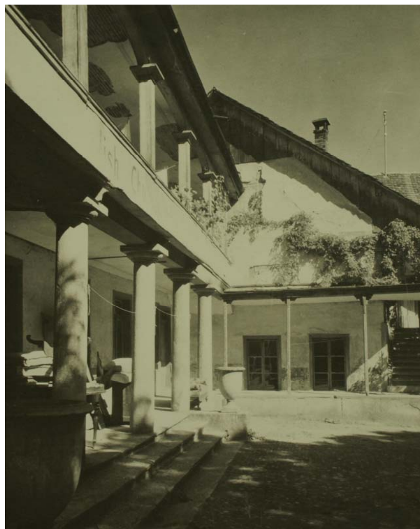
Die limmatseitigen, sehr ländlich anmutenden Bauten des „Staadhofs“ unmittelbar vor deren Abbruch in den 1920er-Jahren.